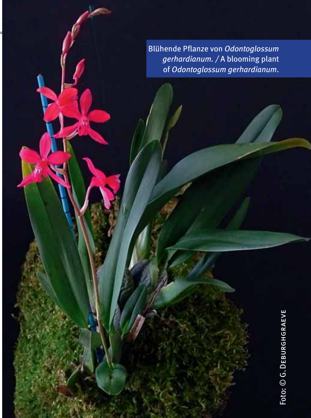
Blühende Pflanze von Odontoglossum gerhardianum . / A blooming plant of Odontoglossum gerhardianum .