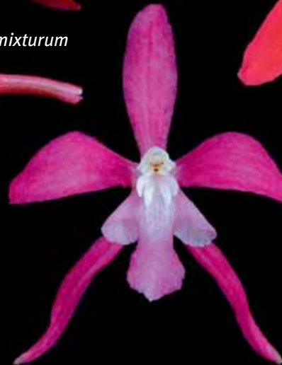
Odontoglossum cf. noezlianum

Fotozusammenstellung/ Photographic composition von/by Guido DEBURGHGRAEVE.